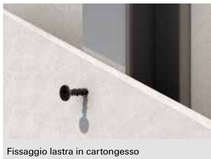
Fissaggio lastra in cartongesso