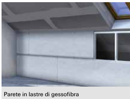
Parete in lastre di gessofibra