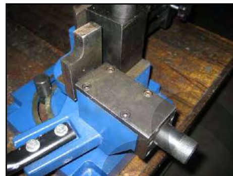
Figura 4 – Regolazione mobile