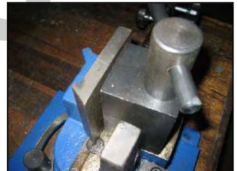
Figura 2 – Morsetto di bloccaggio