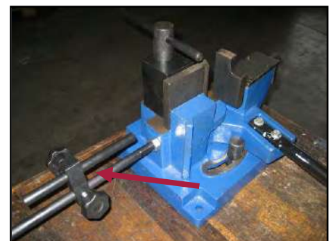
Figura 3 – Battuta pezzo