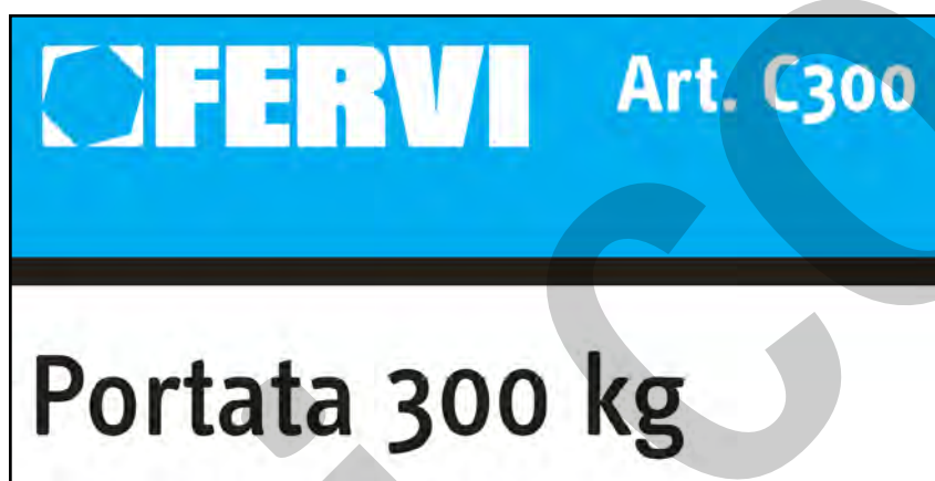
Figura 2 – Dettaglio targhetta

La targa d'identificazione è applicata al telaio (vedere la figura 2).