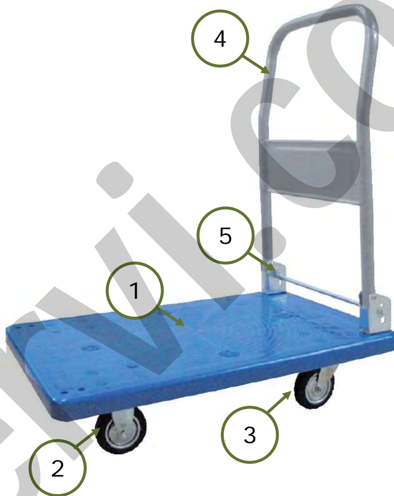
Figura 1 – Vista generale del carrello.

Altri tipi di impiego, oppure l'ampliamento dell'impiego oltre quello previsto, non corrispondono alla destinazione attribuita dal costruttore, e pertanto lo stesso non può assumersi alcuna responsabilità per danni eventualmente risultanti.