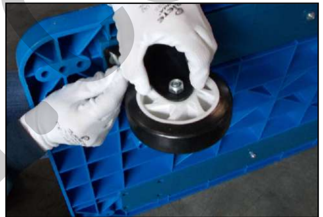
Figura 5 - Inserimento viti di fissaggio