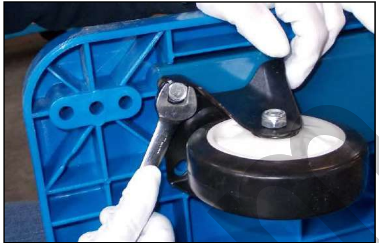
Figura 6 - Stringere le viti