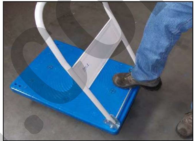
Figura 8 - Ripiegare il timone

Per ripiegare il timone premere con il piede la barra posta nella parte bassa del timone e spingere in avanti lo stesso fino ad adagiarlo sulla piattaforma del carrello.