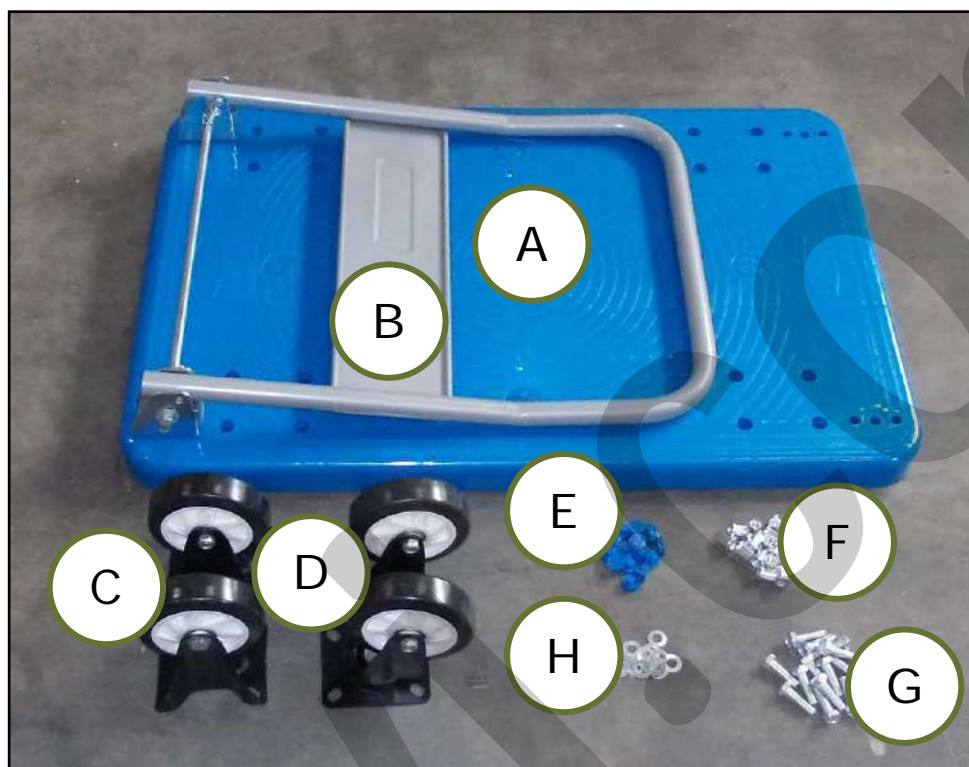
Figura 3 – Parti del carrello smontate.

Il Carrello viene fornito in una scatola di cartone, con le ruote smontate (vedere la figura 3). Prima di eliminare il cartone di imballaggio, controllare di non gettare parti del carrello (ad esempio le viti di fissaggio delle ruote), il manuale di istruzioni o altra documentazione.