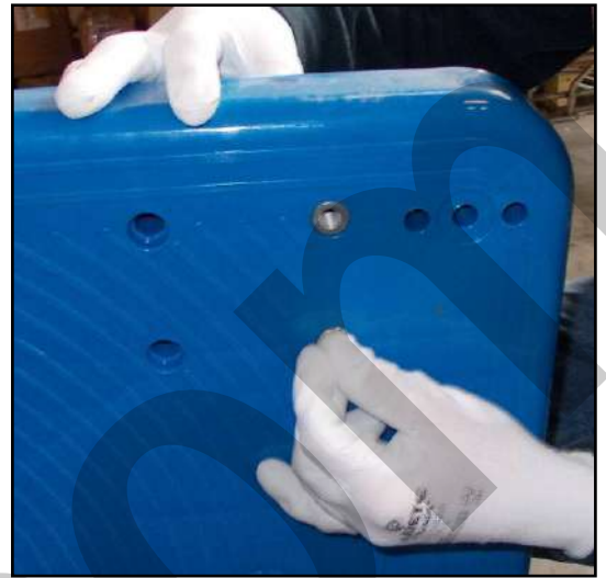
Figura 4 - Inserimento dadi