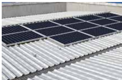
Tetto industriale in lamiera grecata