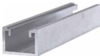
Profilo Solar 40/30