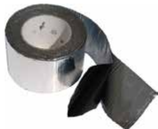
Nastro adesivo butilico CG INT