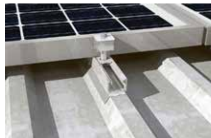
Dettaglio: Fissaggio profilo Solar 40/30