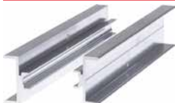
Collegamento CPN AL